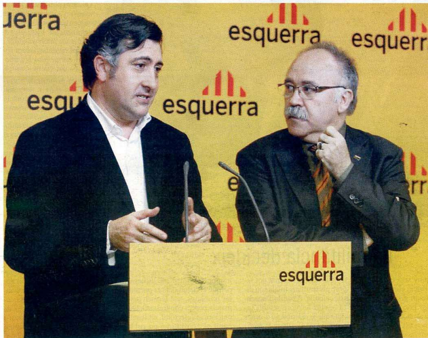
Puigercós i Carod durant la compareixença d'ahir al matí.

► Montilla i el PSC parlen de prudència mentre valoren l'impacte electoral en el tripartit