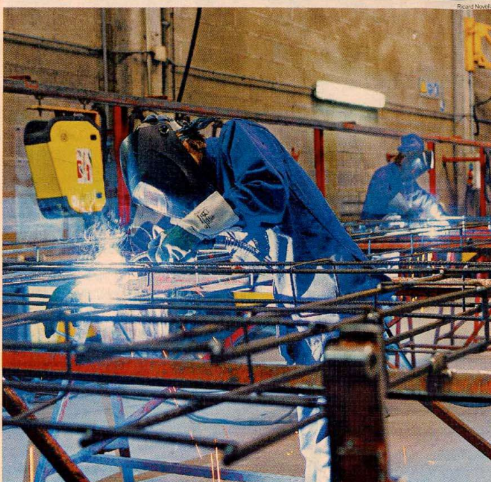
TREBALLADORS. Soldadors de la planta Ferrollet, que té una plantilla completament formada per dones

l'objectiu d'impulsar un model equilibrat de comerç. Anged ha sortit en escena per recordar que fa dotze anys que no s'obre un híper a Catalunya. PÀGINES 4-5